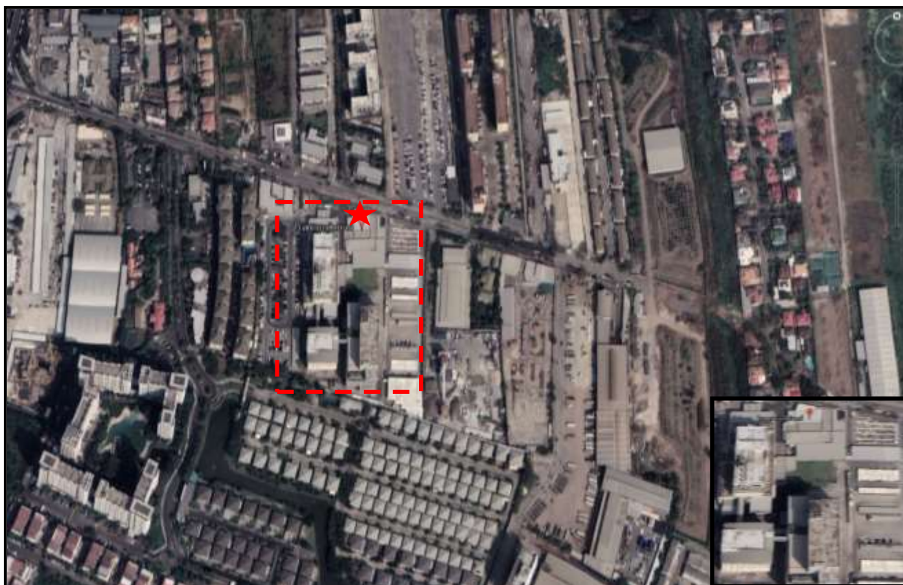
รูปที่ 1.8.1-1 แสดงแผนที่ตั้งโครงการ

โครงการโรงพยาบาลศิริรินทร์ 976 ถนนลาซาล แขวงบางนาใต้ เขตบางนา กรุงเทพมหานคร ดำเนินการโดยบริษัท ศิริรินทร์ จำกัด (มหาชน) แสดงดังรูปที่ 1.8.1-1