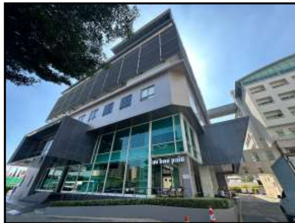
รูปที่ 1.16-1 สภาพโครงการปัจจุบัน